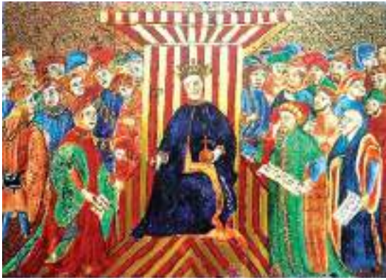
Fig. 1.- CRESPI, Domènec: Llibre del Consolat de Mar . AMV, València, fol. 15r.

del cap i casal . D'una banda, el fet de posseir diverses propietats coadjuva amb la varietat, qualitat i quantitat d'encàrrecs per deduir l'òptima situació financera de Domènec. D'altra, fou l'assentador de les bases de la miniatura gòtica valenciana, i el creador del primer obrador d'il·luminació, d'on suposem la formació de Domingo Adzuara, el gendre, i de Leonard Crespí, el fill. A més, més enllà de l'exercici de la seua professió i de la compra i venda de cases i terrenys, la documentació evidencia que va tenir una vida pública com a ciutadà quan resulta elegit conseller per la parròquia de santa Maria l'any 1406 i continua essent-ho el 1407. 2